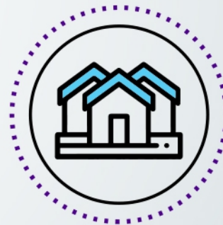
COUNTRIES / BARRIOS CERRADOS