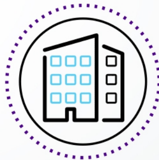
EMPRESAS / OFICINAS