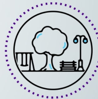
LUGARES PÚBLICOS CON CONTROL DE ACCESO

Además de cualquier tipo de ingreso que requiera control de accesos.